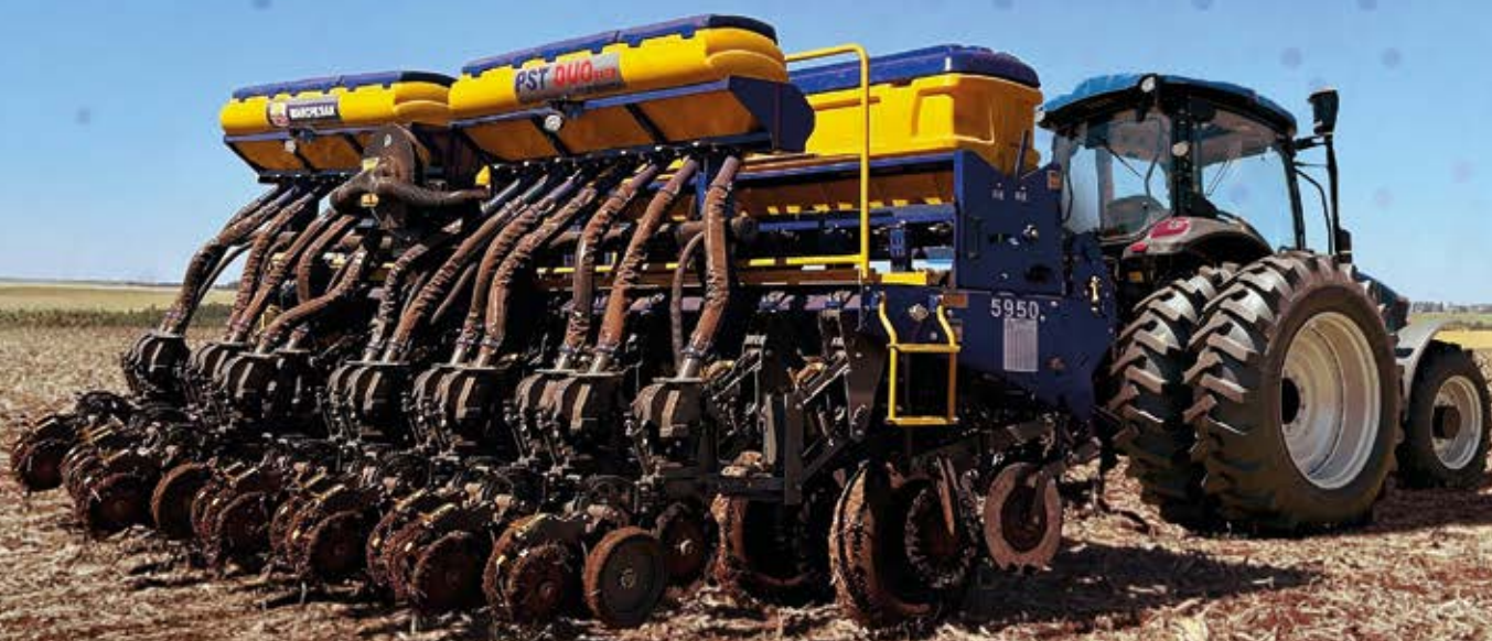
Sembradora TATU MARCHESAN PST DUO