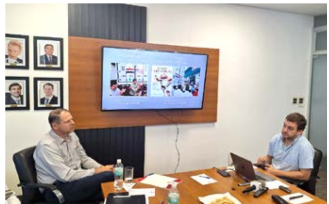
ENVÍOS RECORDS. LA CPC PUNTUALIZÓ LOS NÚMEROS HISTÓRICOS DE LA ACTIVIDAD CÁRNICA.