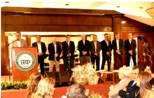
PILAR ECONÓMICO. LA ARP RESALTÓ EL APOORTE DEL SECTOR GANADERO EN LA ECONOMÍA NACIONAL.

en el sector, se indicó, al tiempo de recalcar que sigue pendiente la creación del Instituto Paraguayo de la Carne, como uno de los grandes desafíos. Por el lado de la Asociación Paraguaya de Productores y Exportadores de Carne (APPEC), se indicó que se debe seguir trabajando para la recuperación del hato ganadero que, tras rondar 14,5 millones de cabezas, tuvo un retroceso. Como punto destacado se incluyó que el 2025 cierra con un récord en envíos. Desde el punto de vista institucional, esta organización realizó permanente seguimiento →